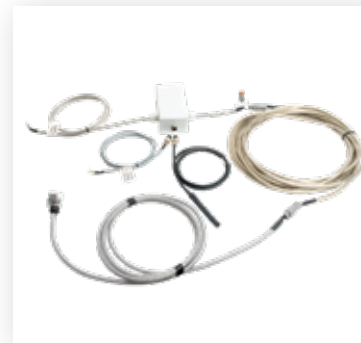
Elektrische Kabelbedienung (für Zusatzfunktionen)