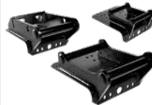
Anbauadapter für Bagger/ Lader/ Forstkräne