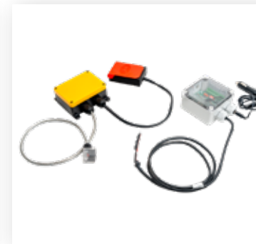
Elektrische Funkbedienung (für Zusatzfunktionen)