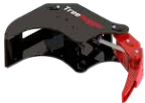
Sammelgreifer Serie S