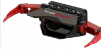
Sammelgreifer Serie E & X